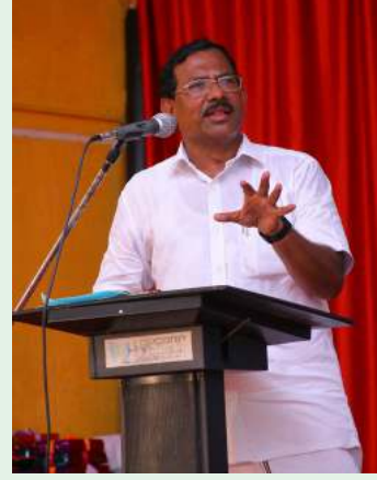
மாண்புமிகு தமிழ் ஆட்சிமொழி, தமிழ்ப் பண்பாடு மற்றும் தொல்லியல் துறை அமைச்சர் திரு.க. பாண்டியராஜன்

விழாவில் சிறப்புரையாற்றிய மாண்புமிகு தமிழ் ஆட்சிமொழி, தமிழ்ப் பண்பாடு மற்றும் தொல்லியல் துறை அமைச்சர் திரு.க.பாண்டியராஜன் அவர்கள், தனது தலைமையின் கீழ் செயல்படும்