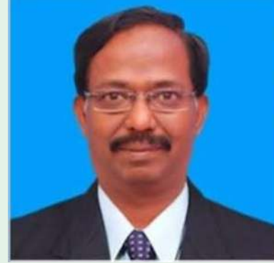
மாண்புமிகு துணைவேந்தர் முனைவர் கோ. பாலசுப்ரமணியன்

ஆறு தமிழ் இயக்ககங்களில் மிகச்சிறிய இயக்ககம் செந்தமிழ்ச் சொற்பிறப்பியல் அகரமுதலித் திட்ட இயக்ககம் என்றாலும் தூயதமிழ்ச் சொற்களை மையப்படுத்தி இளைஞர்களின் மனதில் தூயதமிழ் பற்றிய மிகப்பெரிய தாக்கத்தையும் ஊக்கத்தையும் ஏற்படுத்தி உள்ளது பாராட்டுக்குரிய செயல் என்றும் அகரமுதலி இயக்ககத்தில் ஆயிரக்கணக்கான இளைஞர்கள் இணைந்துள்ளார்கள் என்றும் பேசினார்.